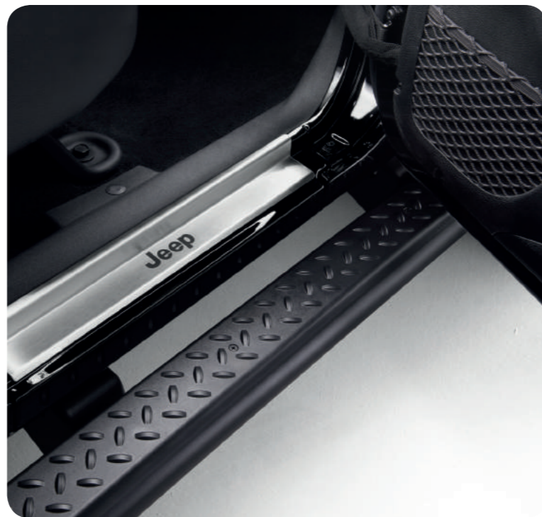
Дверные пороги из полированной нержавеющей стали, украшенные логотипом Jeep®. Накладки на пороги из нержавеющей стали с логотипом Jeep®.