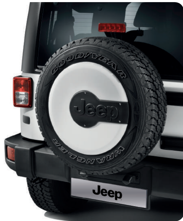
Накладка запасного колеса.