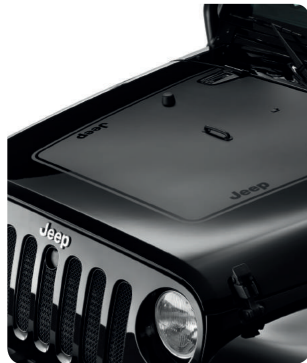
Матовая черная наклейка на капот с логотипом Jeep®. Также доступен матовый серебристый вариант наклейки.