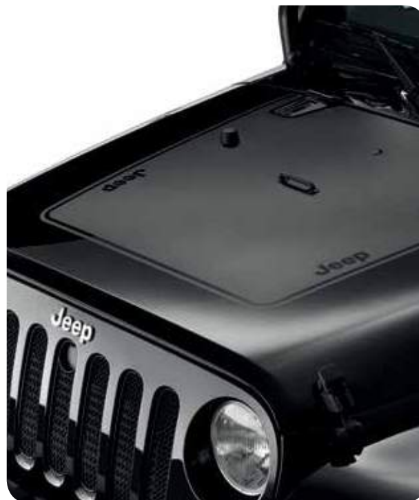
Матовая черная наклейка на капот с логотипом Jeep®. Также доступен матовый серебристый вариант наклейки.