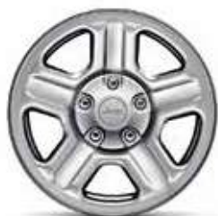
16-дюймовые стальные Стандартное оборудование модификации Sport.