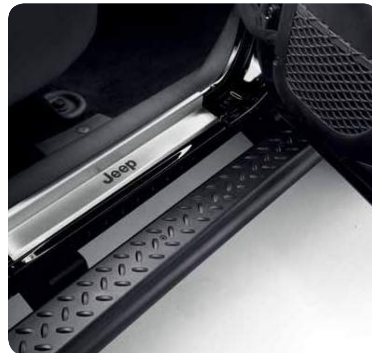
Дверные пороги из полированной нержавеющей стали, украшенные логотипом Jeep®. Накладки на пороги из нержавеющей стали с логотипом Jeep®.