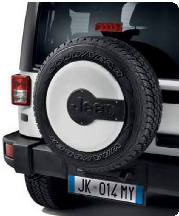
Накладка запасного колеса.