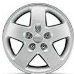
17-дюймовые легкосплавные Стандартное оборудование модификации Sahara, дополнительная опция для модификации Sport.