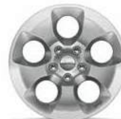
18-дюймовые легкосплавные Дополнительная опция для Sahara.