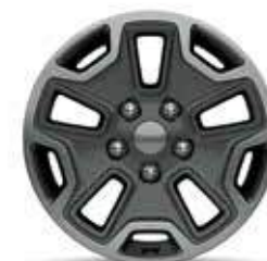
17-дюймовые легкосплавные Стандартное оборудование модификации Rubicon.